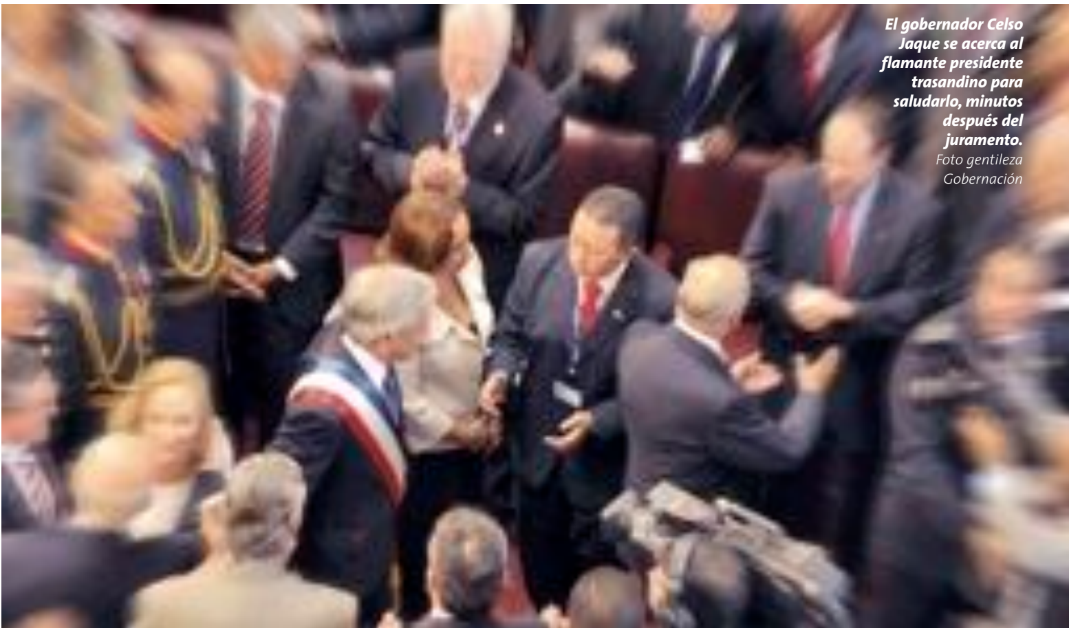
El gobernador Celso Jaque se acerca al flamante presidente trasandino para saludarlo, minutos después del juramento.